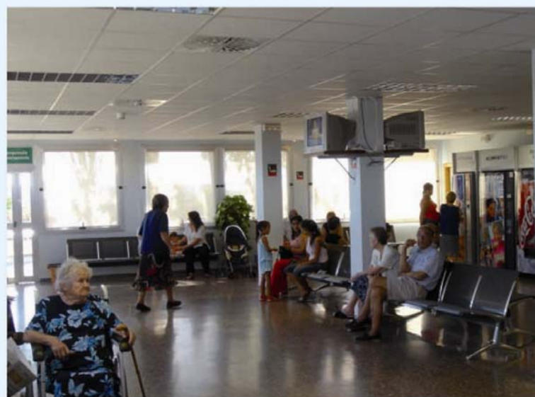
Las enfermeras de la Comunidad Valenciana son de las que más presión asistencial soportan

Como se aprecia en este informe, las enfermeras del Servicio Valenciano de Salud están comparativamente muy mal tratadas, pues cobran menos y trabajan más